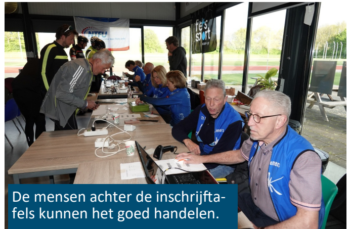
De mensen achter de inschrijftafels kunnen het goed handelen.

Ik neem een kopje koffie en wacht nog even tot Puck en