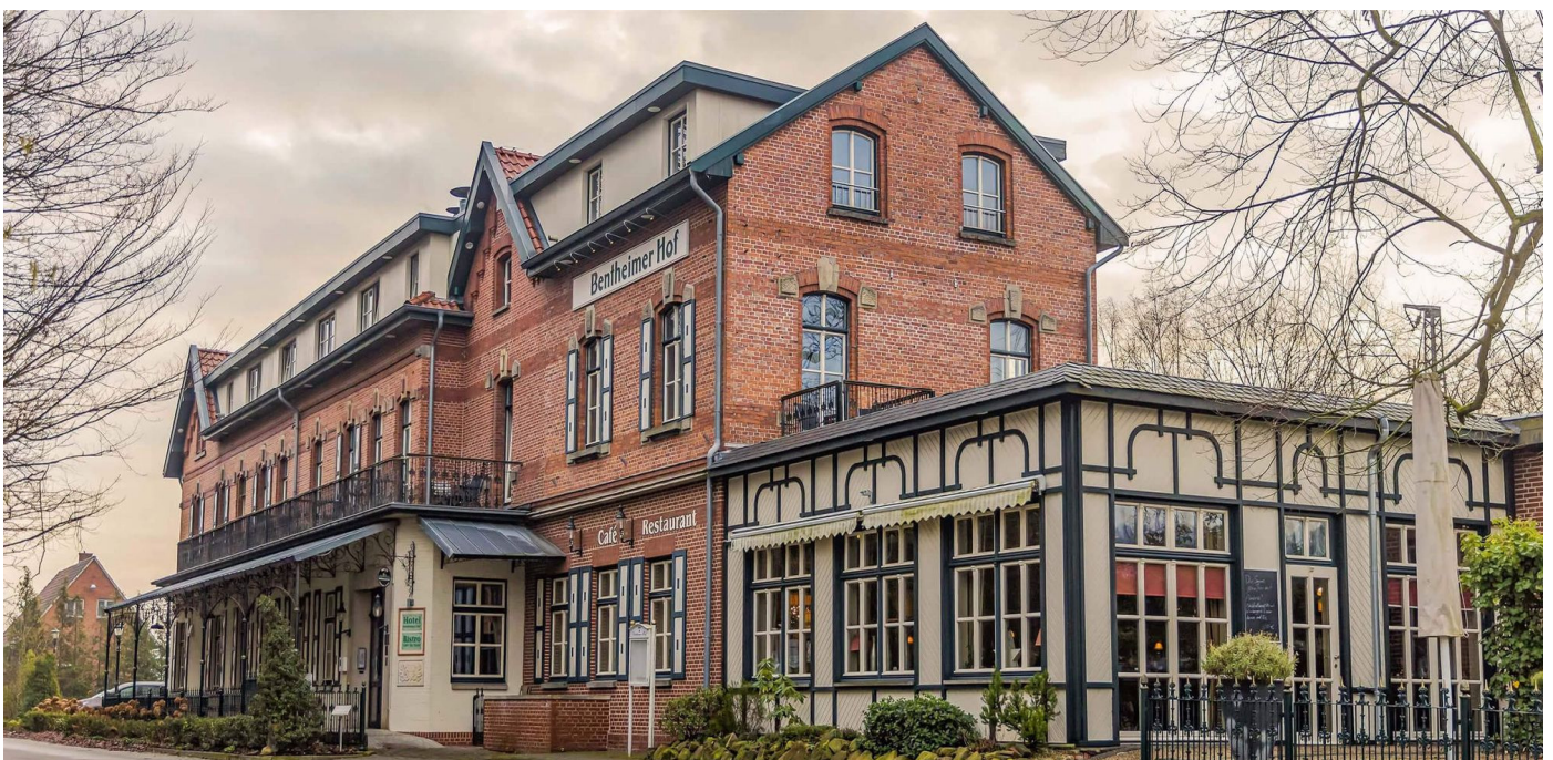
Het hotel Bentheimer Hof in Bad Bentheim wacht op ons.