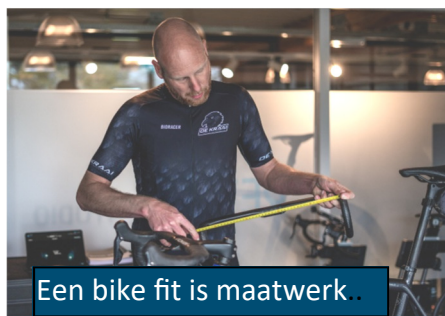
Een bike fit is maatwerk.

Een gelikte website en plaatjes van allerlei apparatuur is mooi maar kijk eens verder en google eens op de software of apparatuur die ze gebruiken. Hoe zijn de ervaringen van andere klanten bij deze fitter? Tegenwoordig zijn er veel fancy systemen maar het systeem is slechts een hulpmid-