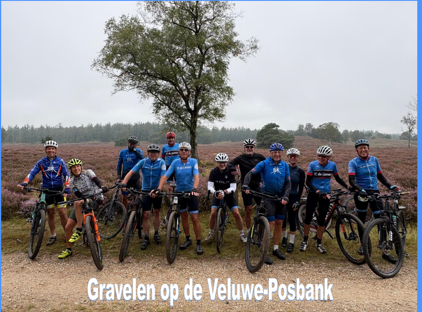
Gravelen op de Veluwe-Posbank