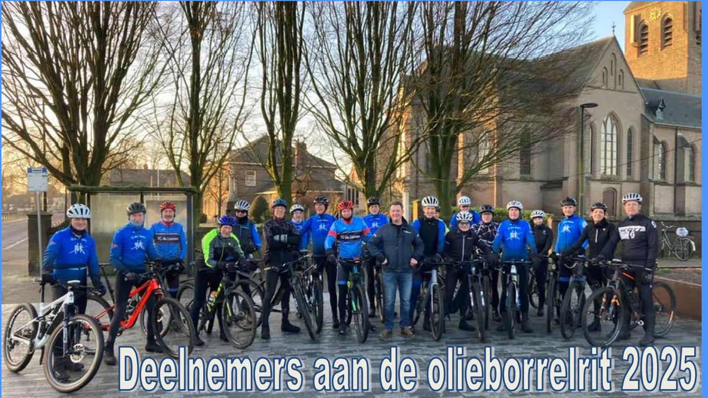
Deelnemers aan de olieborrelrit 2025