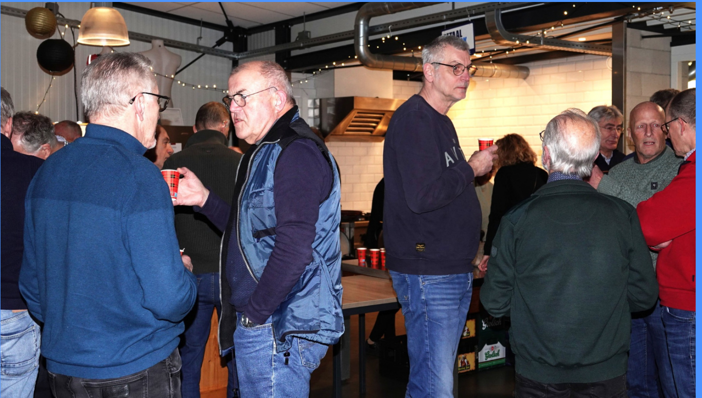
Nieuwjaars receptie 2025