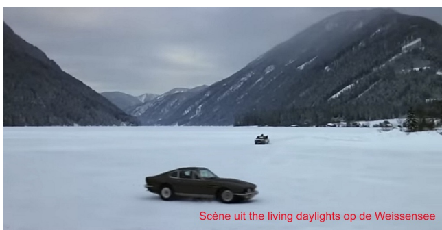
Scène uit the living daylights op de Weissensee